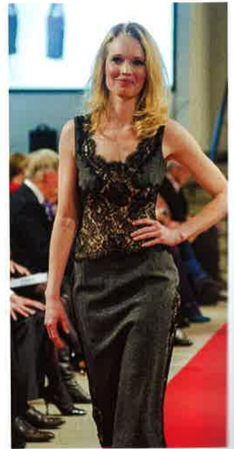
— Noch mehr prominente Kleider: oben ein Cocktailkleid von Jerry Hall, unten ein Nerzjäckchen von Romy Schneider