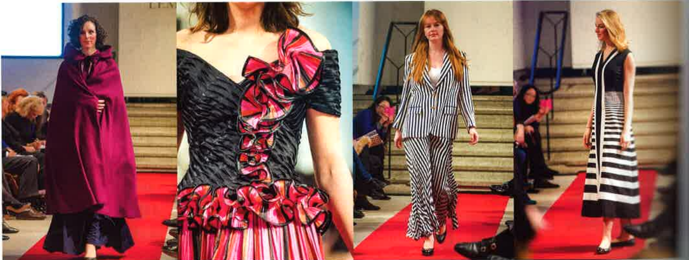
— Schwarz-Weißes von Creation Kohlhaas (Kleid) und Brioni (Hosenanzug), Beschwingtes von Peter Keppler (Cocktailkleid) und Chloé (Cape mit Kapuze)

an seinem Computer verfolgt. Drei, zwei, eins ... meins! Per Telefon erhält ein anderer Bieter den Zuschlag für ein zierliches Tageskleid in Blau.