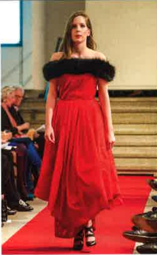
— Echte Hingucker waren diese beiden Haute Couture-Roben: oben ein Abendkleid von Valentino, rechts ein Traum in Seidentaft mit Paillettenstickerei von Escada.