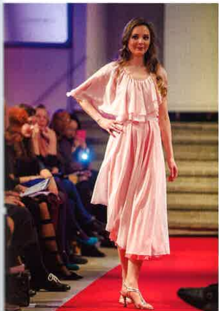
— Zartes Rosé, mal romantisch à la Nina Ricci, mal in strenger A-Linie von Jacques Heim, Paris.

Im Laufe des Abends kommt auch ein Nerzjäckchen unter den Hammer, das Romy Schneider in den sechziger Jahren getragen hat. Das Ergebnis: 1.900 Euro und ein Bieter, der vor Freude jubelt. Ein Abendkleid von Kaiserin Soraya wechselt für 800 Euro den Besitzer – ein Traum in seegrünem Chiffon aus dem Jahre 1964. Denselben Preis erzielt ein schwarz-graues Cocktailkleid, das Jerry Hall um den Jahrtausendwechsel trug. Das Modell aus dem Hause Dolce & Gabbana lässt durch schwarze Spitzeneinsätze tief blicken. Vergleichsweise züchtig, dafür aber leuchtend