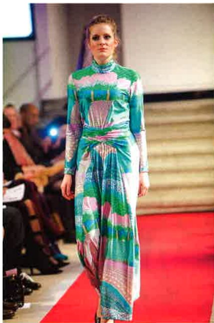
— Farbiger Druck war in den Siebzigern angesagt. Heute kommen Vintage Fans darin groß raus.